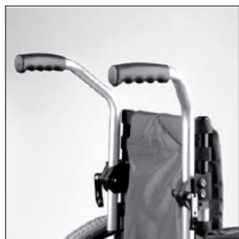
MD 52 Poignées réglables en hauteur