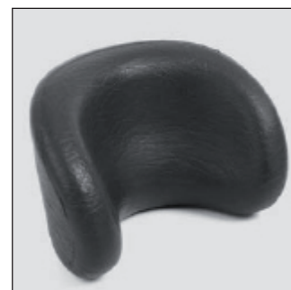
MZ 53 Appui-tête*