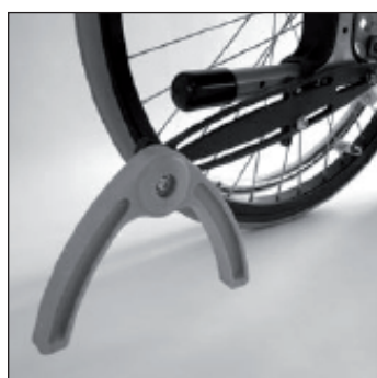
MA 62 Anti bascule pendulaire