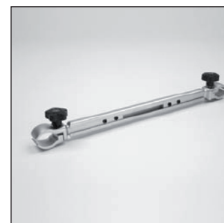
MZ 54 Kit de montage clinique*