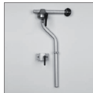
MZ 55 Set de montage Appui-tête*