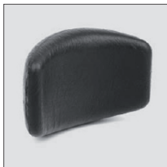
MD 23 Cale tronc