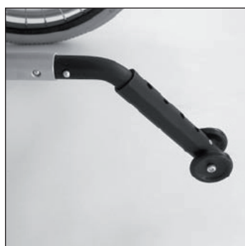
MA 55 Anti bascule simple

Inclinaison d'assise maximale s'élève à 3,5 cm.