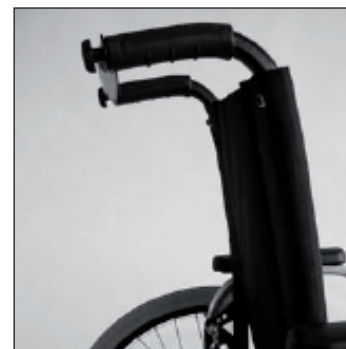
MD 10 Dossier inclinable rabattable sur l'assise avec tendeur de dossier