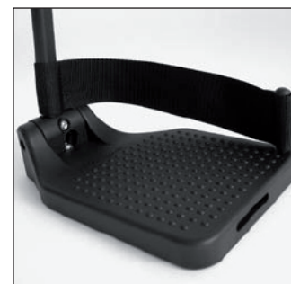
MB 72 Talonnières

* Pour tout autre modèle d'accessoires, veuillez vous reporter à la page 165 du catalogue.