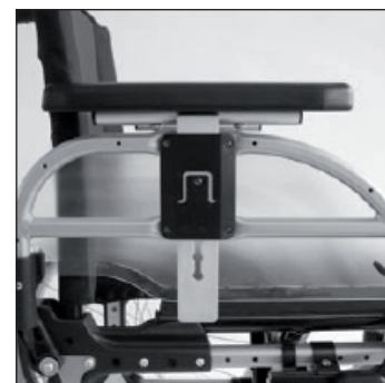
ME 05 Accoudoirs arrondis avec manchettes réglables en hauteur